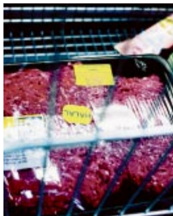
POPULÆR VARE. Halalkjøttdeigen går unna. Neste uke ventes storinnrykk når ramadan avsluttes.